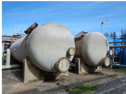
รูปที่ 3-15 Filtering System