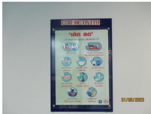
รูปที่ 3-55 บอร์ดประชาสัมพันธ์ด้านความปลอดภัย อาชีวอนามัย และสิ่งแวดล้อม

ภาพถ่ายประกอบผลการปฏิบัติตามมาตรการป้องกัน และแก้ไขผลกระทบสิ่งแวดล้อม โครงการโรงงานผลิตคาโปรแลคตัม บริษัท อุเบะ เคมิคอลส์ (เอเชีย) จำกัด (มหาชน) (ต่อ)