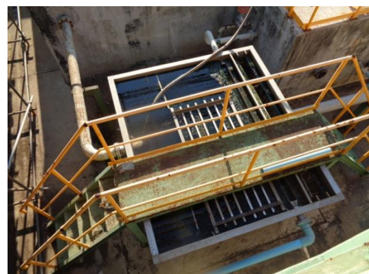
รูปที่ 3-11 Oil Separation System

ภาพถ่ายประกอบผลการปฏิบัติตามมาตรการป้องกัน และแก้ไขผลกระทบสิ่งแวดล้อม โครงการโรงงานผลิตคาโปรแลกตั้ม บริษัท อุเบะ เคมิคอลส์ (เอเชีย) จำกัด (มหาชน) (ต่อ)