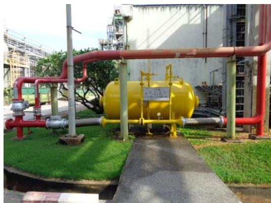
รูปที่ 3-49 Fixed Foam Discharge Outlet