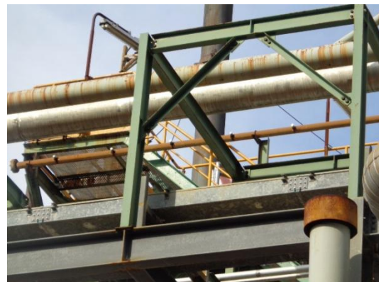
รูปที่ 3-44 Water Curtain System

ภาพถ่ายประกอบผลการปฏิบัติตามมาตรการป้องกัน และแก้ไขผลกระทบสิ่งแวดล้อม โครงการโรงงานผลิตคาโปรแลคตัม บริษัท อุเบะ เคมิคอลส์ (เอเชีย) จำกัด (มหาชน) (ต่อ)