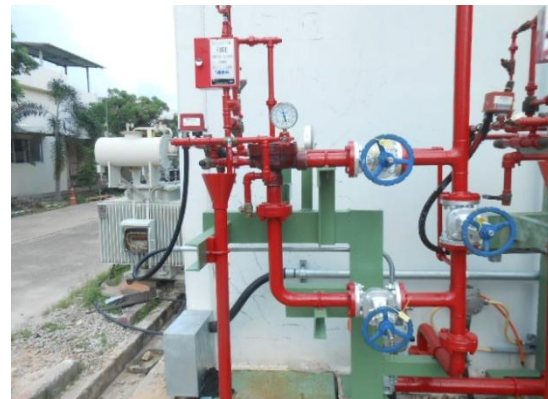
รูปที่ 3-42 Deluge System