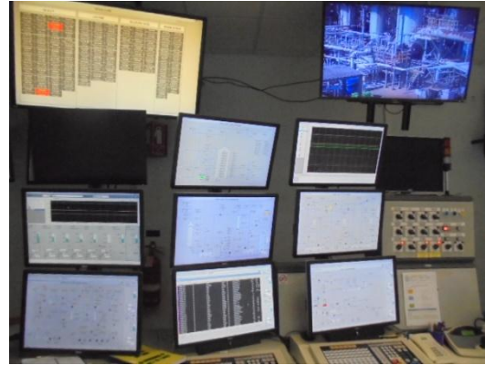
รูปที่ 3-7 Interlock System