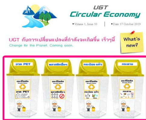
รูปที่ 3-26 บอร์ดประชาสัมพันธ์รณรงค์คัดแยกขยะ