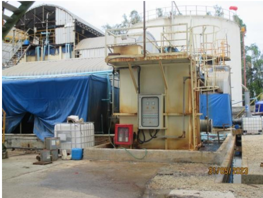
รูปที่ 3-18 ระบบบำบัดน้ำเสียทางเคมีและชีวภาพ