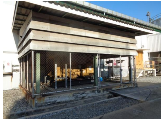
รูปที่ 3-4 ระบบไฟฟ้าสำรองของโรงงาน