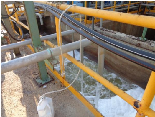
รูปที่ 3-20 Chemical Sewer