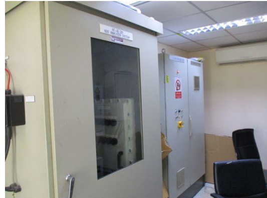
รูปที่ 3-2 เครื่องตรวจวัดความเข้มข้นของมลพิษ ทางอากาศอย่างต่อเนื่อง (CEMS)