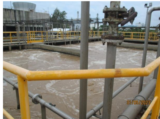
รูปที่ 3-13 Activated Sludge System