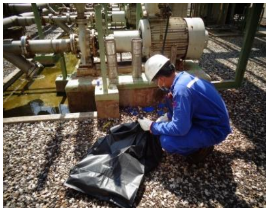
รูปที่ 3-8 การทำความสะอาดหน่วยผลิต