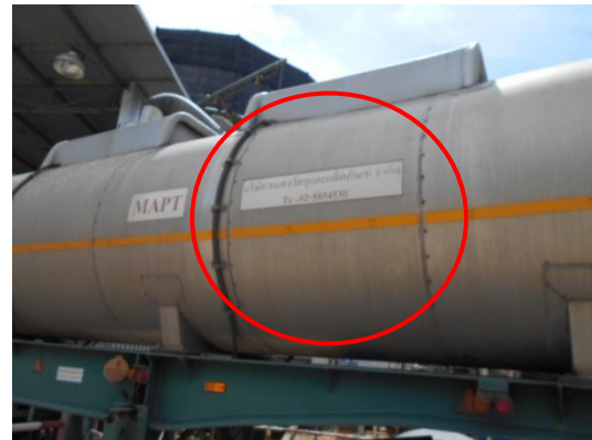
รูปที่ 3-27 รถขนส่ง/รถขนส่งกากของเสีย ที่มีการติดหมายเลขโทรศัพท์