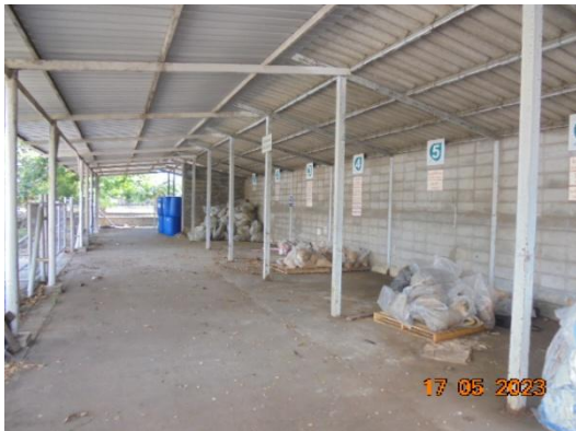
รูปที่ 3-30 อาคารเก็บกากของเสียรอกำจัด (Waste Holding Building)