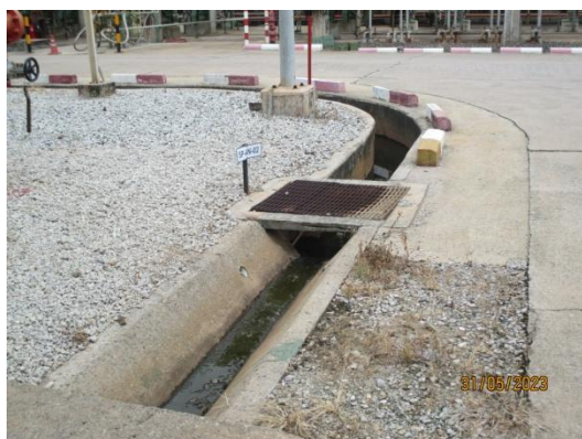
รูปที่ 3-10 รางระบายน้ำแบบเปิด