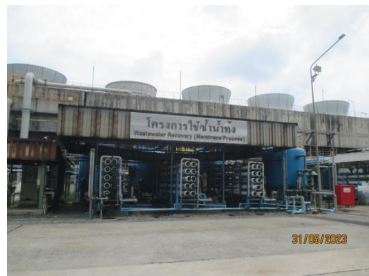
รูปที่ 3-17 Reverse Osmosis

ภาพถ่ายประกอบผลการปฏิบัติตามมาตรการป้องกัน และแก้ไขผลกระทบสิ่งแวดล้อม โครงการโรงงานผลิตคาโปรแลกต์ัม บริษัท อุเบะ เคมิคอลส์ (เอเชีย) จำกัด (มหาชน) (ต่อ)