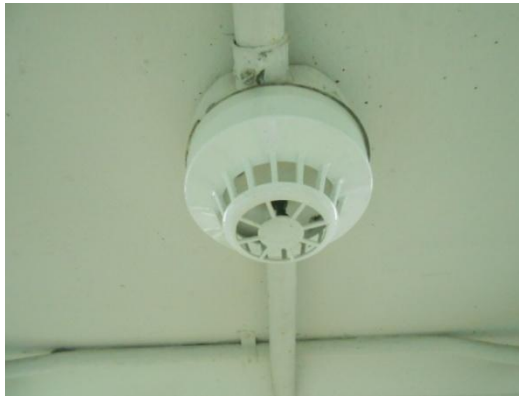
รูปที่ 3-39 Heat Detector