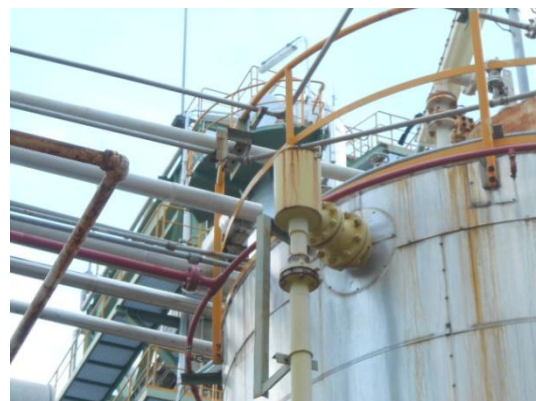
รูปที่ 3-50 Fixed Foam Spray System

ภาพถ่ายประกอบผลการปฏิบัติตามมาตรการป้องกัน และแก้ไขผลกระทบสิ่งแวดล้อม โครงการโรงงานผลิตคาโปรแลคตัม บริษัท อุเบะ เคมิคอลส์ (เอเชีย) จำกัด (มหาชน) (ต่อ)