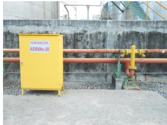
รูปที่ 3-48 Foam Hydrant