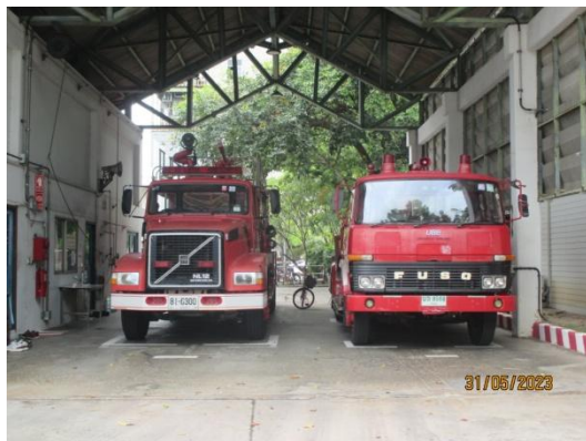
รูปที่ 3-53 Fire Truck