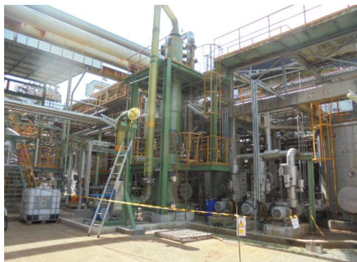
รูปที่ 3-5 ระบบกำจัดกลิ่นกำมะถัน (Sulfur Scrubber 4110-S1)

ภาพถ่ายประกอบผลการปฏิบัติตามมาตรการป้องกัน และแก้ไขผลกระทบสิ่งแวดล้อม โครงการโรงงานผลิตคาโปรแลกตาม์ บริษัท อุเบะ เคมิคอลส์ (เอเชีย) จำกัด (มหาชน)