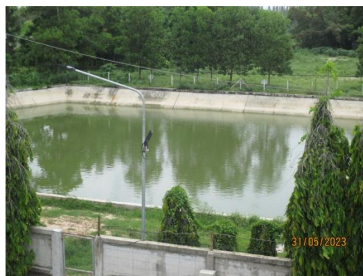
รูปที่ 3-59 บ่อรองรับน้ำฝนปนเปื้อน

ภาพถ่ายประกอบผลการปฏิบัติตามมาตรการป้องกัน และแก้ไขผลกระทบสิ่งแวดล้อม โครงการโรงงานผลิตคาโปรแลกค์ บริษัท อุเบะ เคมีคอลส์ (เอเชีย) จำกัด (มหาชน) (ต่อ)