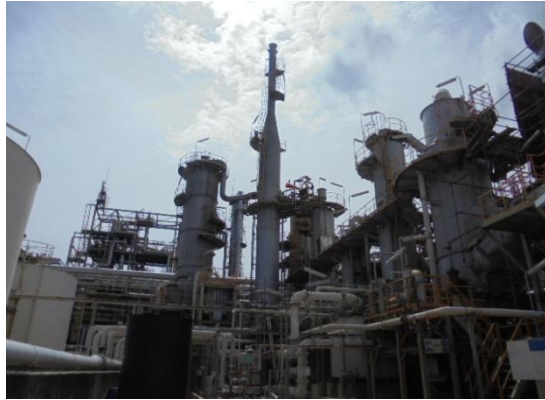
รูปที่ 3-6 Double-Contact/Double Absorption เพื่อบำบัด SO 2 และ Acid Mist