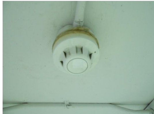
รูปที่ 3-40 Smoke Detector