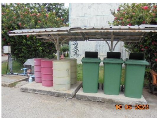
รูปที่ 3-28 ถังขยะแบบแยกประเภท