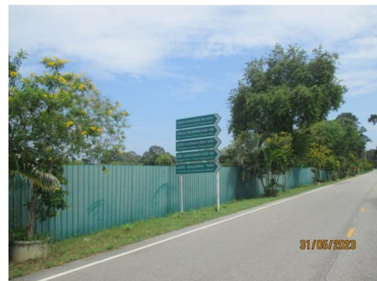
รูปที่ 3-33 ป้ายและสัญลักษณ์ให้ผู้ขับขี่ยานพาหนะ รับทราบล่วงหน้าก่อนถึงพื้นที่โครงการ

ภาพถ่ายประกอบผลการปฏิบัติตามมาตรการป้องกัน และแก้ไขผลกระทบสิ่งแวดล้อม โครงการโรงงานผลิตคาโปรแลคตัม บริษัท อุเบะ เคมิคอลส์ (เอเชีย) จำกัด (มหาชน) (ต่อ)