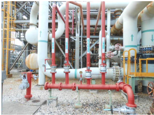
รูปที่ 3-45 Fixed Water Suppression System