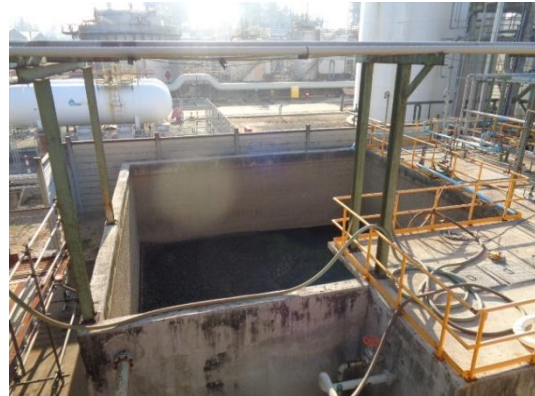
รูปที่ 3-19 Oily Sewer