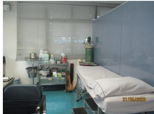
รูปที่ 3-57 ห้องพยาบาล