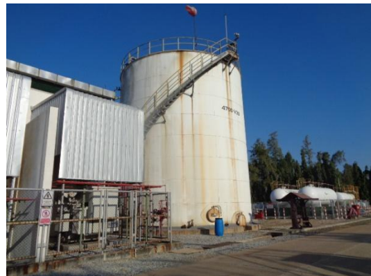
รูปที่ 3-21 Equalization Cooler