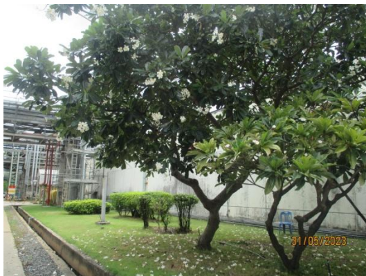
รูปที่ 3-58 พื้นที่สีเขียว