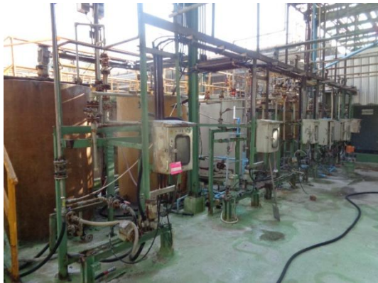
รูปที่ 3-12 pH Adjustment System