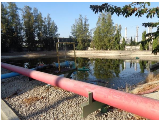
รูปที่ 3-22 Final Check Basin ขนาด 3,300 ลูกบาศก์เมตร