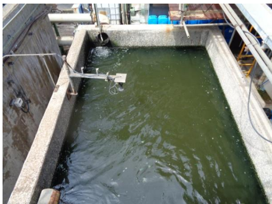
รูปที่ 3-16 Chlorination System