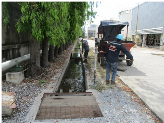
รูปที่ 3-24 การขุดลอกรางระบายน้ำ