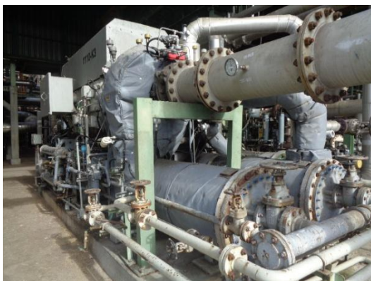
รูปที่ 3-32 ฉนวนกันเสียงในบริเวณที่มีเสียงดัง