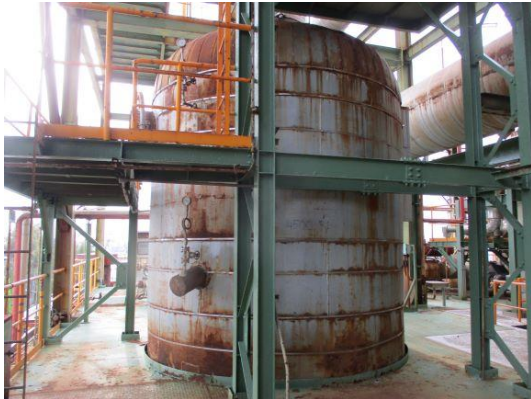
รูปที่ 3-1 Waste Gas Treatment Off Gas เพื่อบำบัด \text{NO}_x