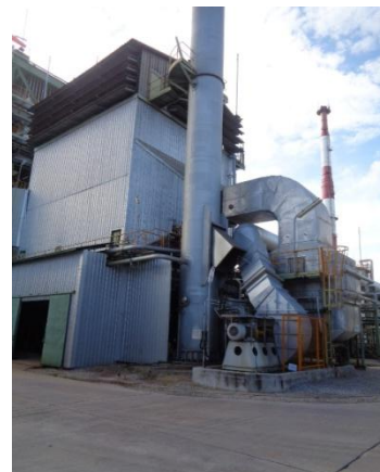
รูปที่ 3-9 อุปกรณ์บำบัดฝุ่น (Electrostatic Precipitator) จาก Boiler Type