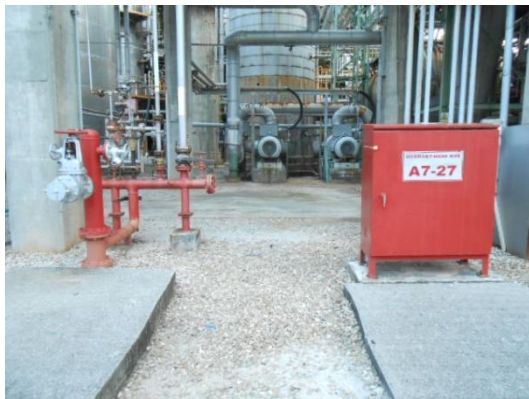
รูปที่ 3-41 Water Hydrant and Hose Box