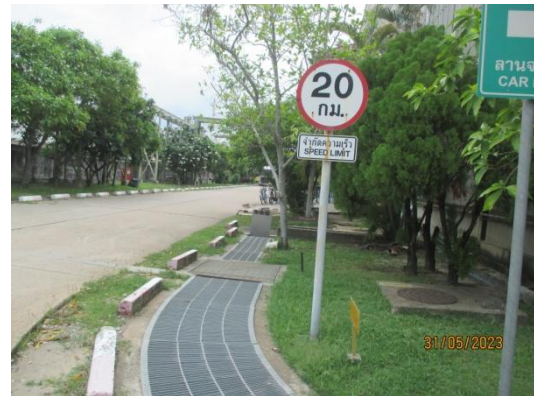
รูปที่ 3-34 ป้ายจำกัดความเร็วรถ