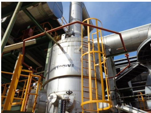
รูปที่ 3-43 Fixed Water Spray System