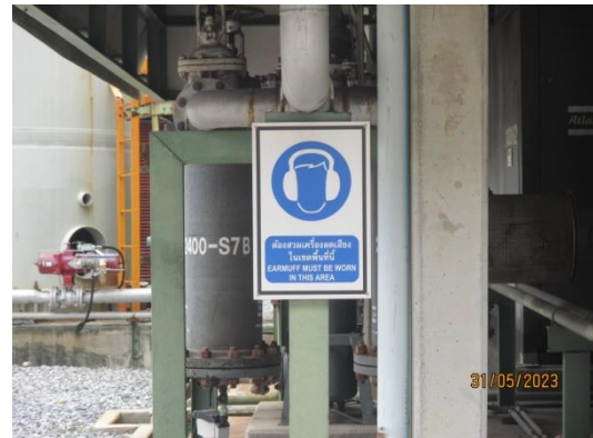
รูปที่ 3-31 ป้ายเตือนให้พนักงานสวมใส่อุปกรณ์ ป้องกันเสียงดัง