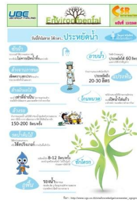
รูปที่ 3-25 บอร์ดประชาสัมพันธ์รณรงค์ใช้น้ำ อย่างประหยัด