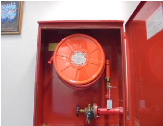
รูปที่ 3-47 Stand Pipe and Hose System