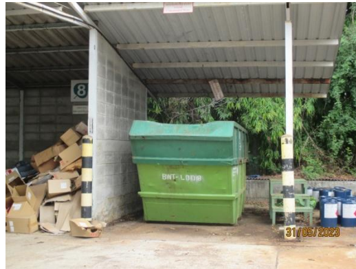
รูปที่ 3-29 ถังเก็บรวบรวมขยะทั่วไปรอส่งกำจัด