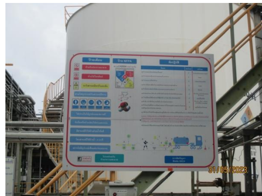
รูปที่ 3-54 ข้อมูลความปลอดภัยของสารเคมี (SDS)