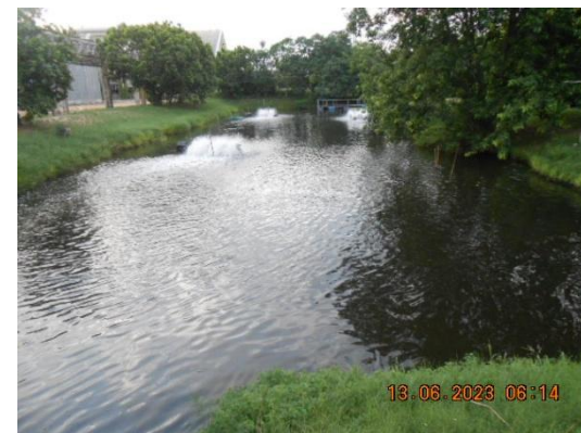
รูปที่ 3-23 Holding Pond

ภาพถ่ายประกอบผลการปฏิบัติตามมาตรการป้องกัน และแก้ไขผลกระทบสิ่งแวดล้อม โครงการโรงงานผลิตคาโปรแลคตัม บริษัท อุเบะ เคมิคอลส์ (เอเชีย) จำกัด (มหาชน) (ต่อ)