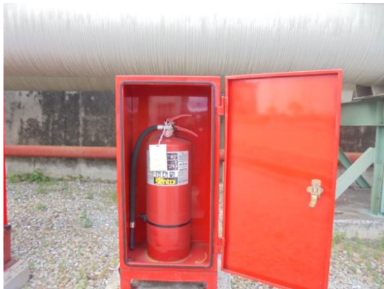
รูปที่ 3-51 Portable Fire Extinguisher