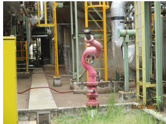
รูปที่ 3-46 Fixed Water Monitor